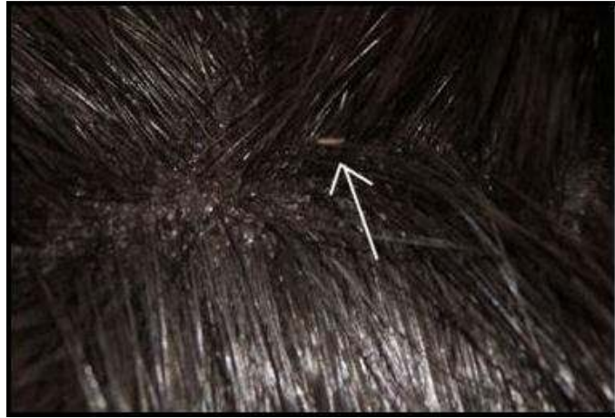
En lus i en marsvinepels