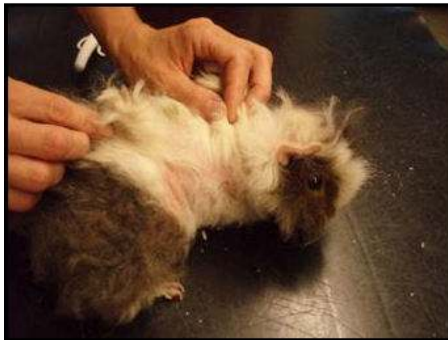
Skab på marsvin

Marsvin kan sagtens være raske smittebærere, dvs. gå rundt med miden i årevis uden at være påvirket af den. Hvis marsvinet så udsættes for stress eller andet der kan nedsætte deres immunforsvar, vil miden begynde at formere sig og symptomerne vil vise sig.