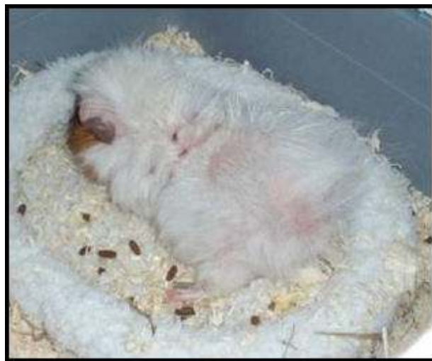
Skab på marsvin

Ivomec gives som injektion eller i munden. Marsvinet skal behandles min. 2 gange med 10-14 dages mellemrum. Det normale er at man hos dyrlægen behandler marsvinene med en injektion med midlet, hvilket godt kan være lidt smertefuldt, da det svier og marsvin i øvrigt har en tyk hud som gør det lidt sværere at stikke. Behandling med injektion virker formentlig hurtigere end oral behandling, og kan være at foretrække hos marsvin med voldsomme symptomer på skab. Har man mange marsvin er det værd at nævne for dyrlægen at man også kan behandle oralt, sådan at man ikke skal slæbe alle marsvin med til dyrlægen, men kan få medicin med hjem og give resten af marsvinene.