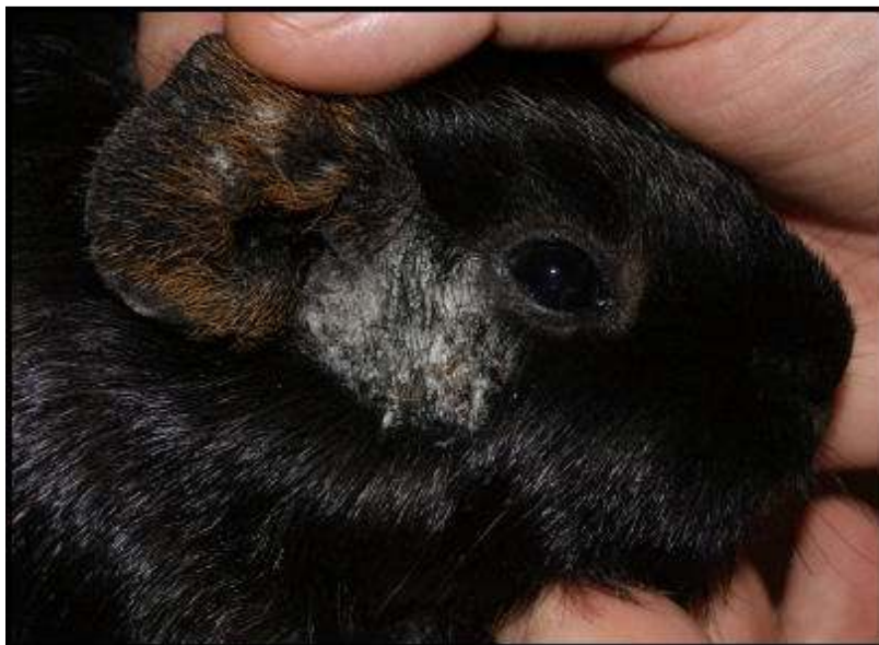
Plet med svamp på marsvin

Har man med ringorm at gøre, skal alle børster, håndklæder, bure og omgivelserne omkring burene desinficeres. Svampene danner sporer, der kan svæve rundt i hele lokalet hvor marsvinene står og kan også fordele sig ud til andre rum.